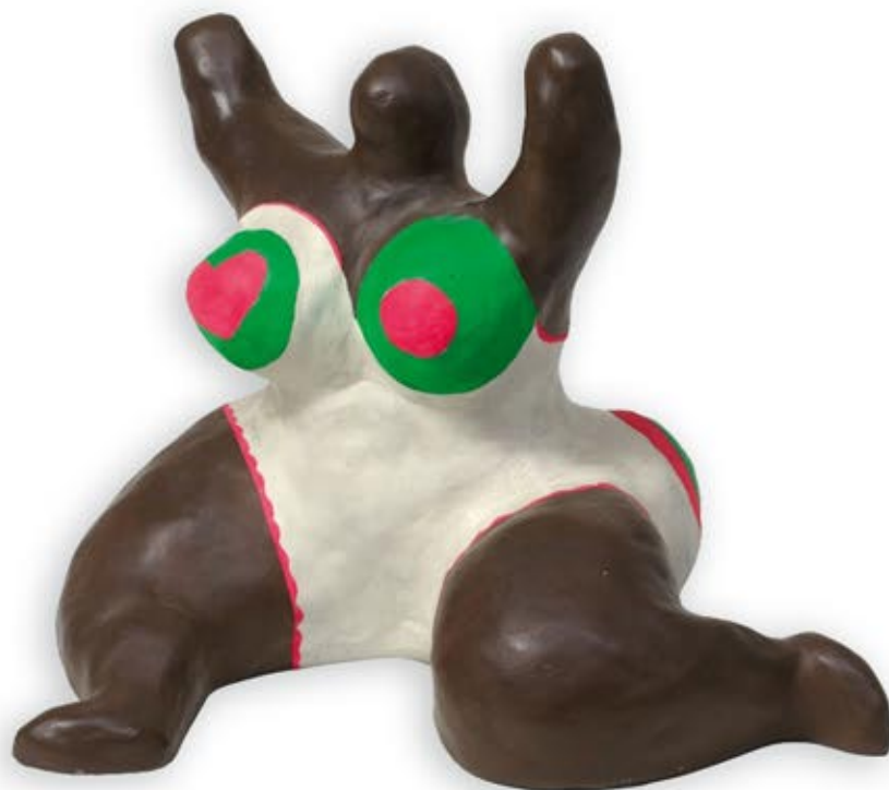
Niki de Saint Phalle (1930 Neuilly-sur-Seine - 2002 San Diego) Limit: 6.500 €